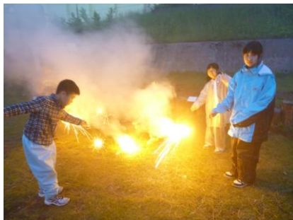
【キャンプファイヤー】