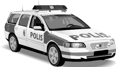
白と黒の車 (パトカー)