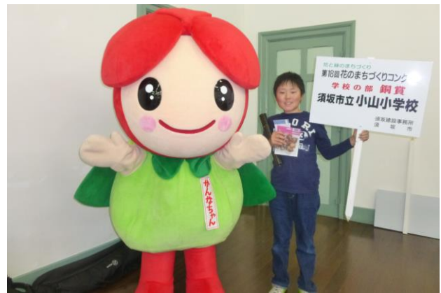
第18回須坂市花のまちづくりコンクール 学校の部 銅賞

9月28日(日)に行われた駅伝大会に小山小学校から2チームが参加。Aチームは、第1走者から1位を譲ることなく見事優勝。3年生主体のBチームも6位で大健闘。