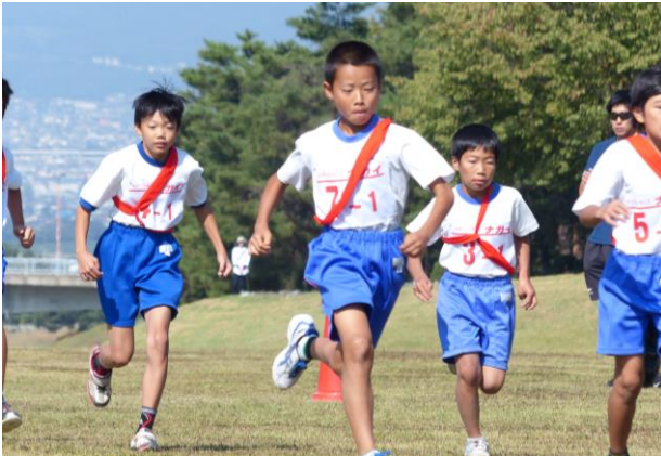
第7回須高小中学生クロスカントリー 駅伝競走大会 小山小Aチーム 第1位

9月28日(日)に行われた駅伝大会に小山小学校から2チームが参加。Aチームは、第1走者から1位を譲ることなく見事優勝。3年生主体のBチームも6位で大健闘。