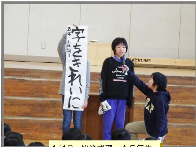
1/10, 始業式で。↑5年生、 ↓3年生の発表から。